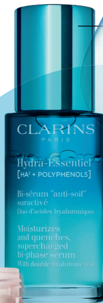
HYDRA-ESSENTIEL BI-PHASE SERUM € 68,50 CLARINS.COM

Ze zeggen wel 'als je haar maar goed zit', maar 'als je huid maar goed oogt' is minstens zo belangrijk. En dat doe je door een serum te gebruiken die de boel weer in balans brengt.