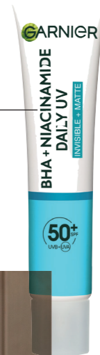
€ 11,99 ETOS.NL