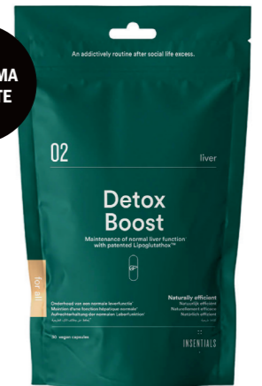
DETOX BOOST € 70 INSENTIALS.COM

Iets te veel wijntjes, iets te veel bewerkt eten, iets te weinig lichaamsbeweging; wie niet als een heilige leeft kan best te maken krijgen met een vervette lever. Kijk 'ns op de site van Insentials, specialist in natuurlijke supplementen, samengesteld op basis van wetenschappelijke inzichten. Deze Detox Boost helpt je gezondheid en daar ga je van stralen.