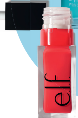
E.L.F. GLOW REVIVER LIP OIL RED DELICIOUS € 9 ETOS.NL

Deze glossy 'reviver' lipolie verzacht, verzorgt en laat je lippen hun kleur hervinden.